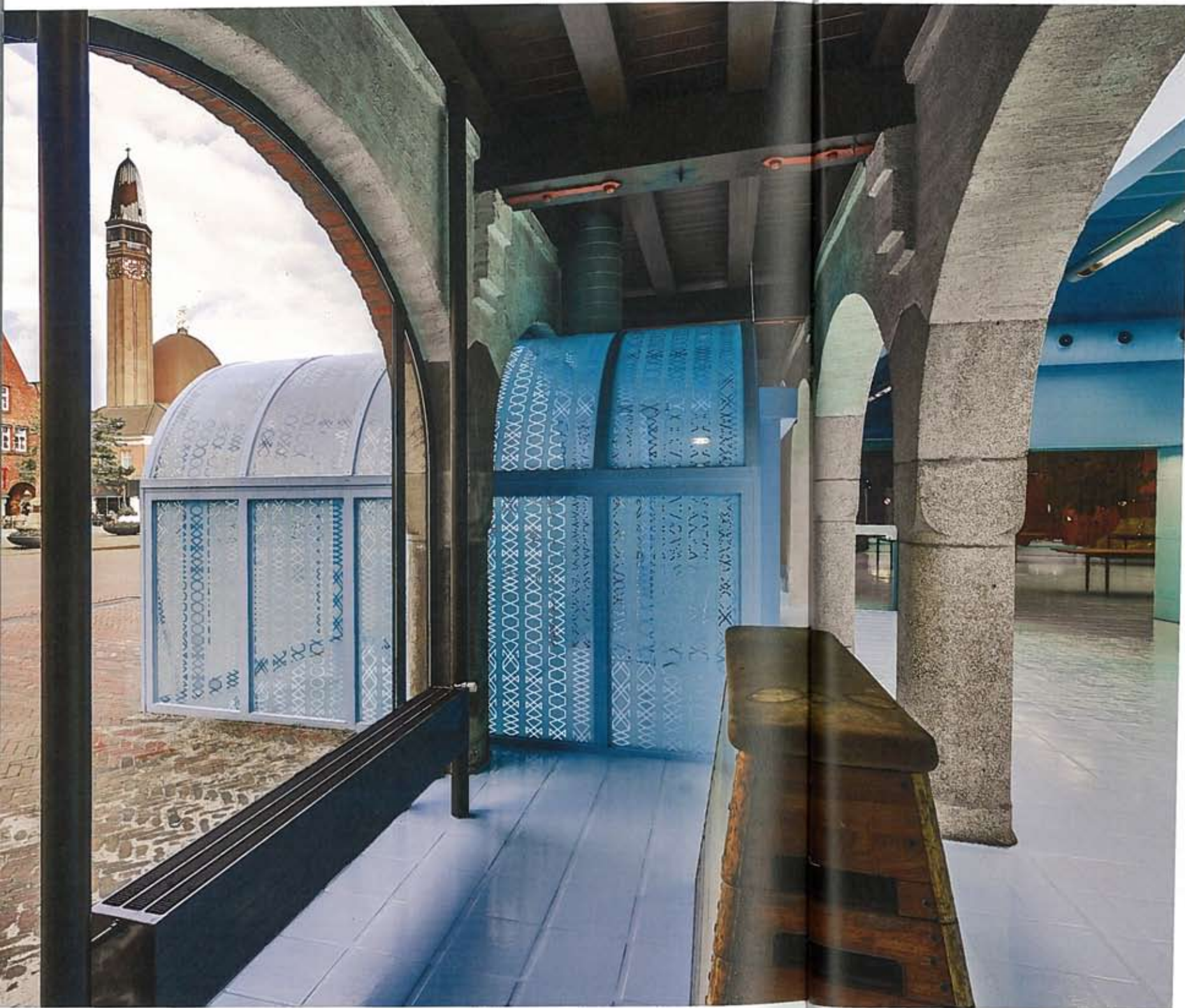
1 Entree en tentoonstellingshal 2 Werkruimte met lederen gordijnen