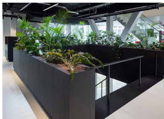
FOTO LINKSBOVEN In de 'huiskamer' kunnen de engineers in teams werken in een informele setting, voor de presentaties is er een tribune gemaakt.

FOTO RECHTSBOVEN De medewerkers hebben geen vaste werkplek, maar kunnen aansluitend bij hun activiteiten kiezen uit een variatie aan werk-, overleg- en ontspanningsplekken.