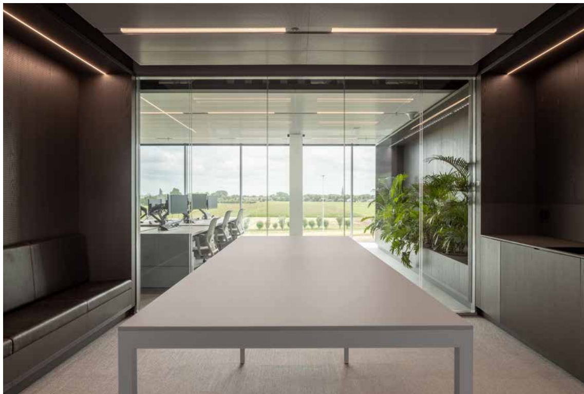
FOTO LINKERPAGINA Het interieur van Lely Campus fase 02 biedt een 'Work smarter' omgeving, speciaal ingericht om de werkprocessen van de medewerkers optimaal te ondersteunen.

totaal" zegt architect Eline Strijkers. "Wij hebben zowel het interieur voor de eerste als de tweede fase ontworpen, met in totaal ruim 20.000 m 2 kantoorinterieur inclusief aanverwante functies, zoals het bedrijfsrestaurant. Er werken zo'n 1350 mensen, dus het gebouw moest vooral een 'great place to work' worden, met de nadruk op het ontmoeten van collega's." Hiervoor zijn dan ook allerlei voorzieningen gecreëerd, waaronder