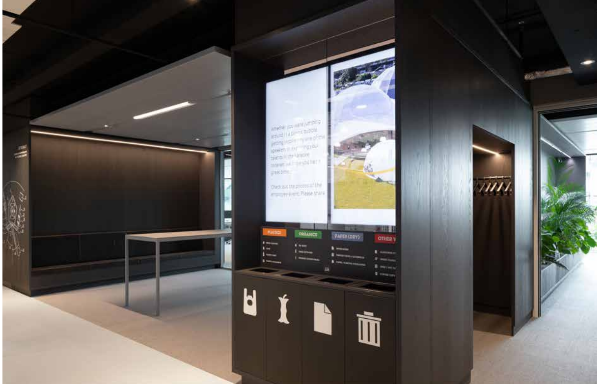
FOTO BOVEN RNDR heeft alle grafiek zoals de signing en de content voor de smart walls en de vergaderkamers vormgegeven.

ONDER Schematische weergave van de verschillende activiteiten, met gescheiden zones voor geconcentreerd werken en ontmoeten.