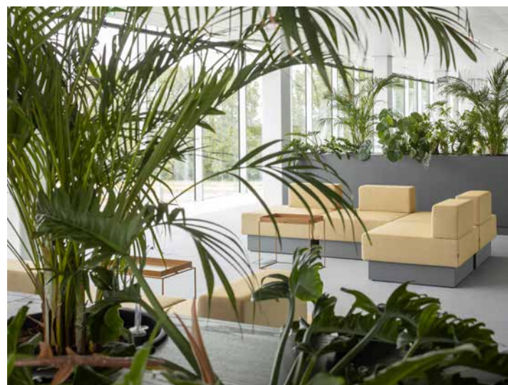
FOTO LINKSBOVEN Om op de kantoorvloeren dynamiek en concentratie te combineren is over de hele lengte van het gebouw een tweedeling gemaakt, met aan de ene zijde de werkzone en aan de andere kant de zone voor sociale interactie