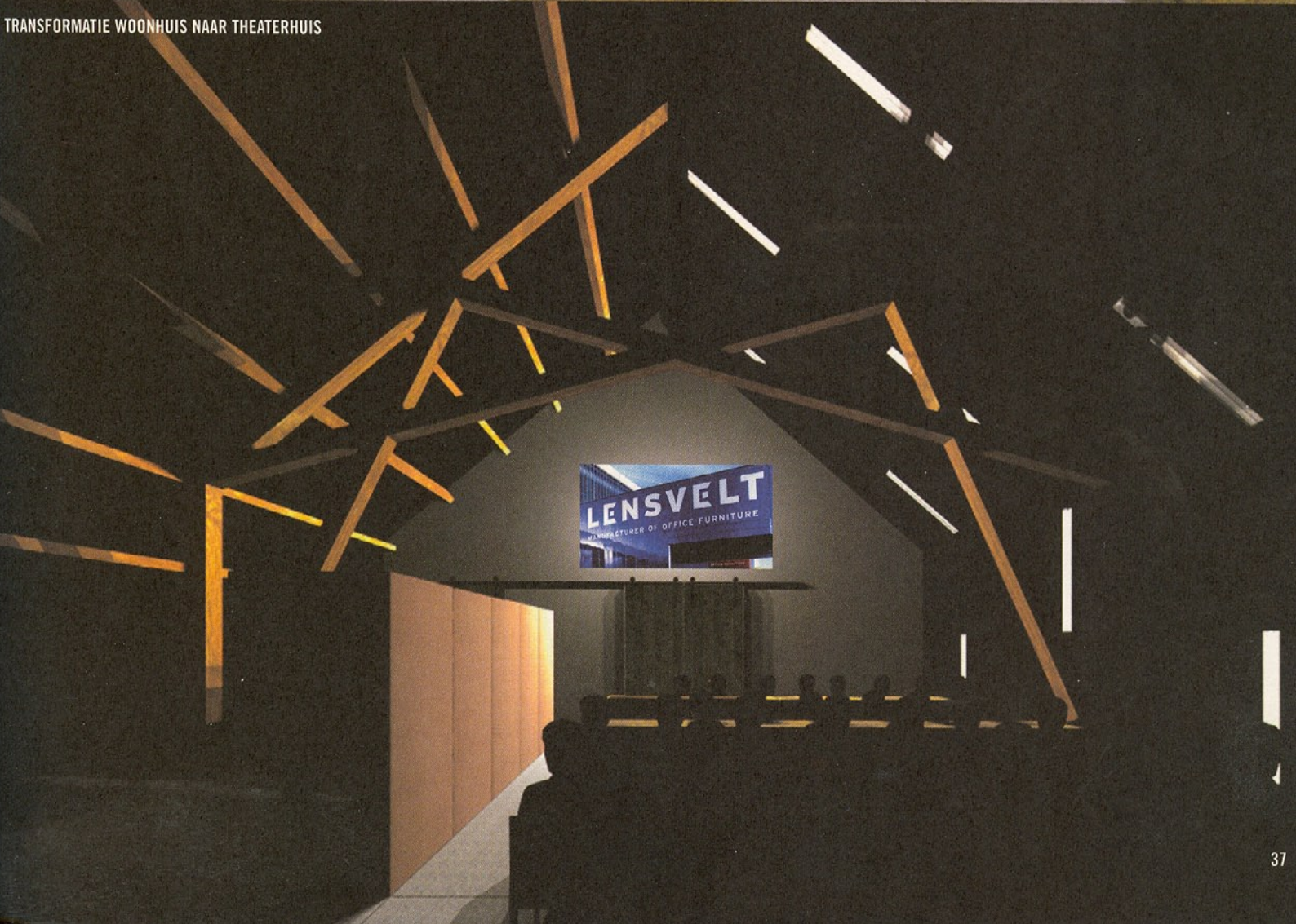
TRANSFORMATIE WOONHUIS NAAR THEATERHUIS